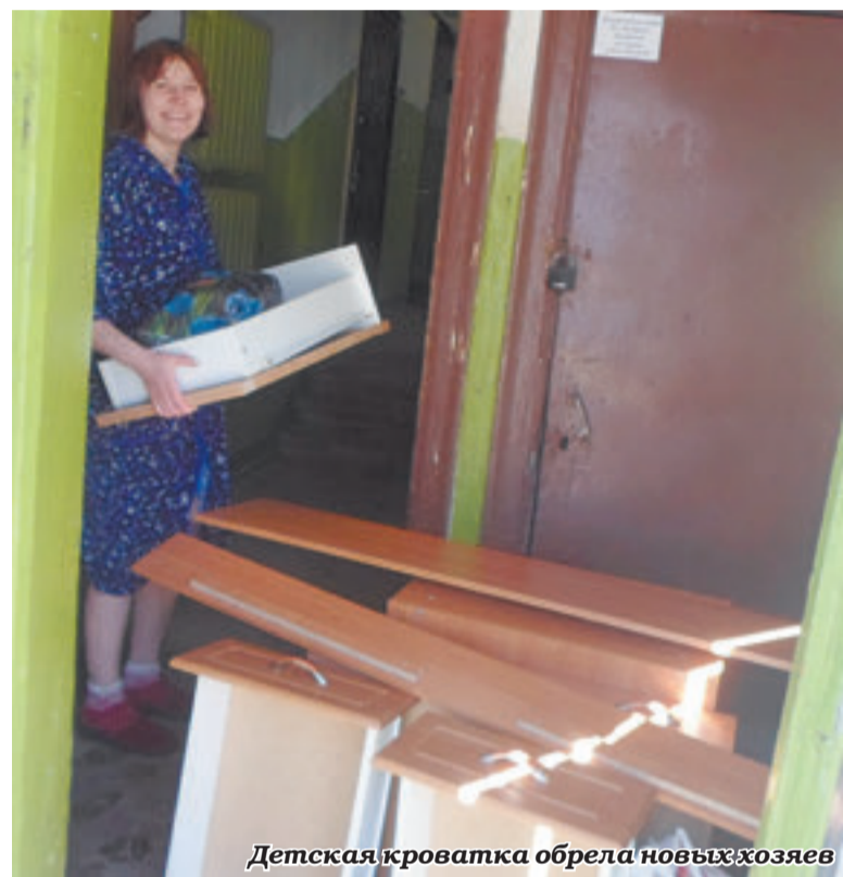
Детская кроватка обрела новых хозяев

Анкеты волонтеров можно взять в Александро-Невском храме или по адресу: пр-т Испытателей 25/2, комната №100.