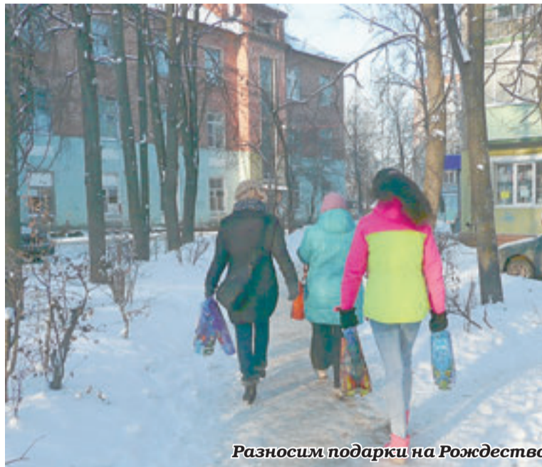
Разносим подарки на Рождество

А на самом деле все просто, «секрет жизни» заключен в