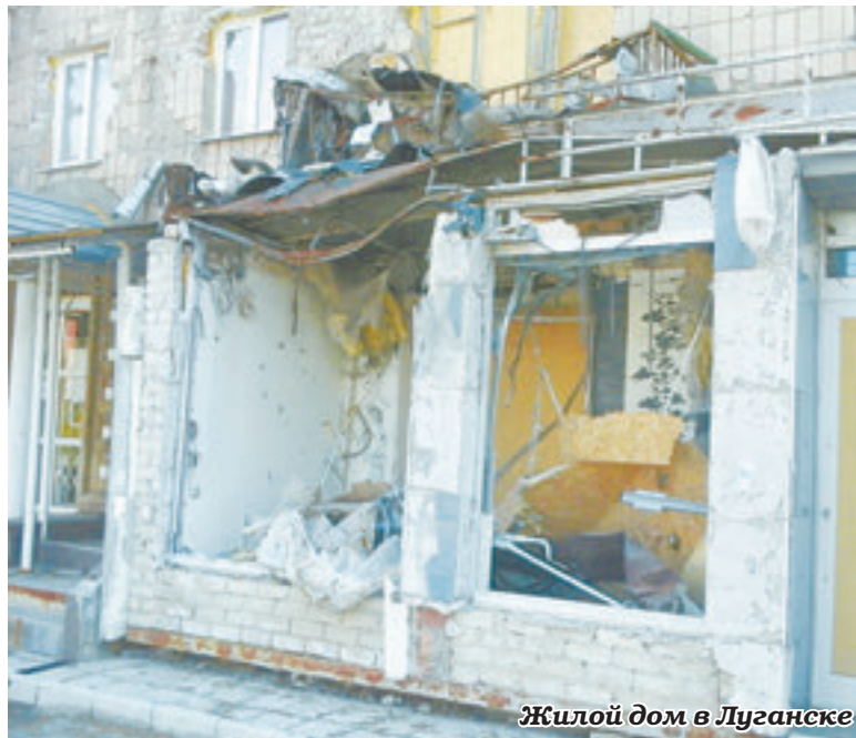
Жилой дом в Луганске