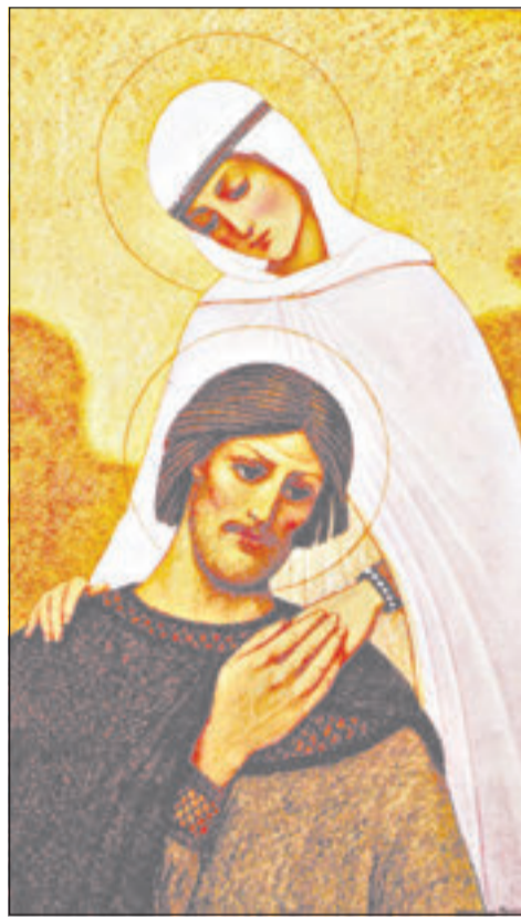
Петр и Павел

Несколько лет назад 8 июля, в День памяти Петра и Февронии, в России стали отмечать День семьи, любви и верности. (О том, как этот праздник проходил в Красноармейске, читайте на второй полосе).