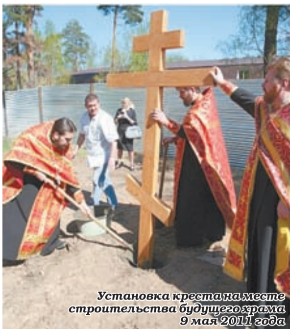
Установка креста на месте строительства будущего храма 9 мая 2011 года