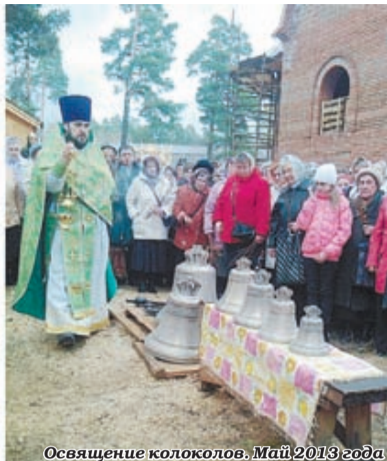
Освящение колоколов. Май 2013 года