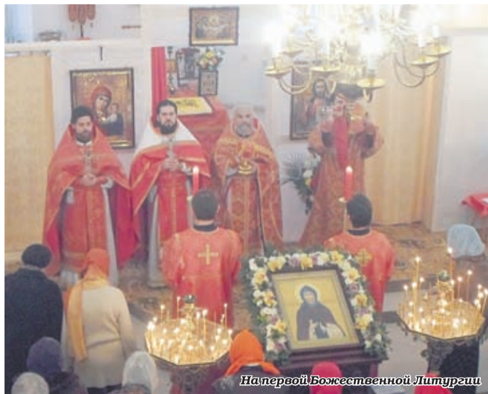
На первой Божественной Литургии