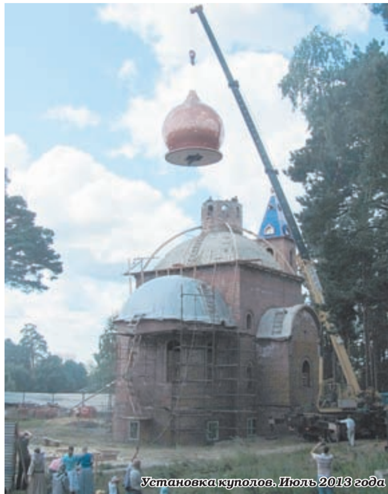
Установка куполов. Июль 2013 года