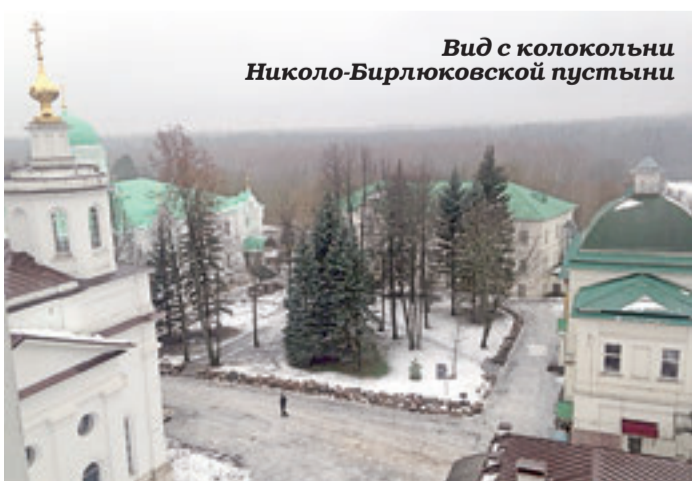
Вид с колокольни Николо-Берлюковской пустыни